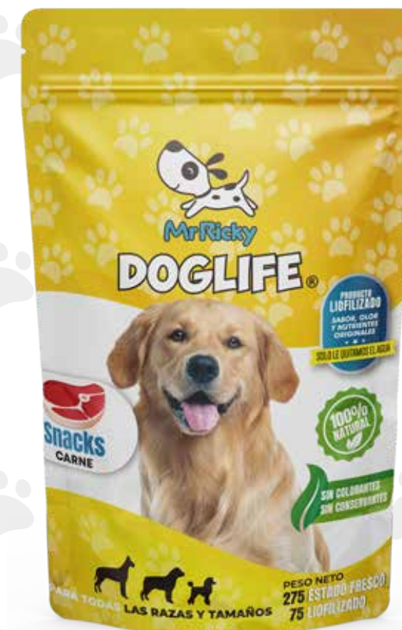
Snack de carne 75g.