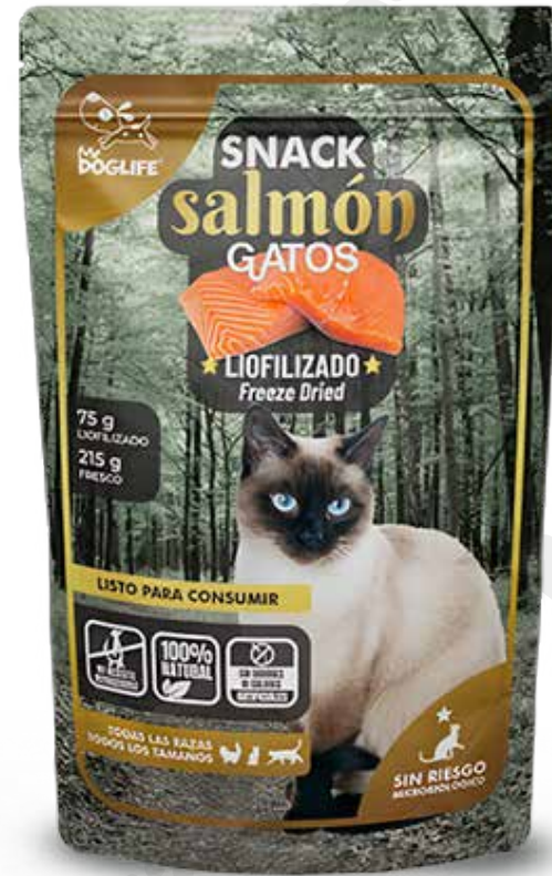
Snack de salmón 75 g