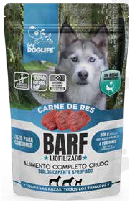
Barf carne de res 200 gms liofilizados