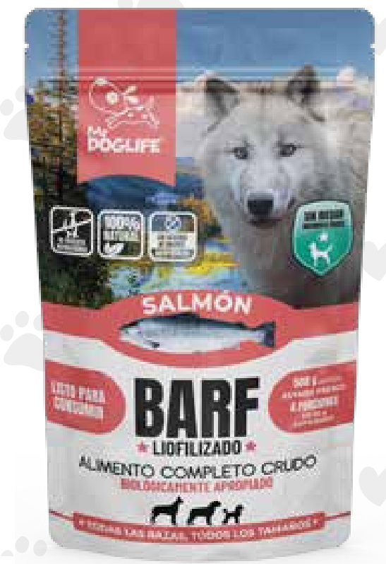
Barf salmón 200 gms liofilizados