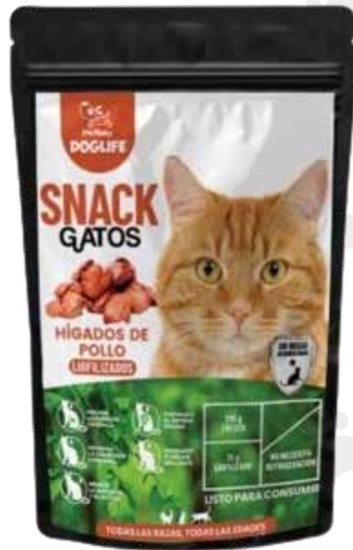
Snack hígado de pollo 75 g