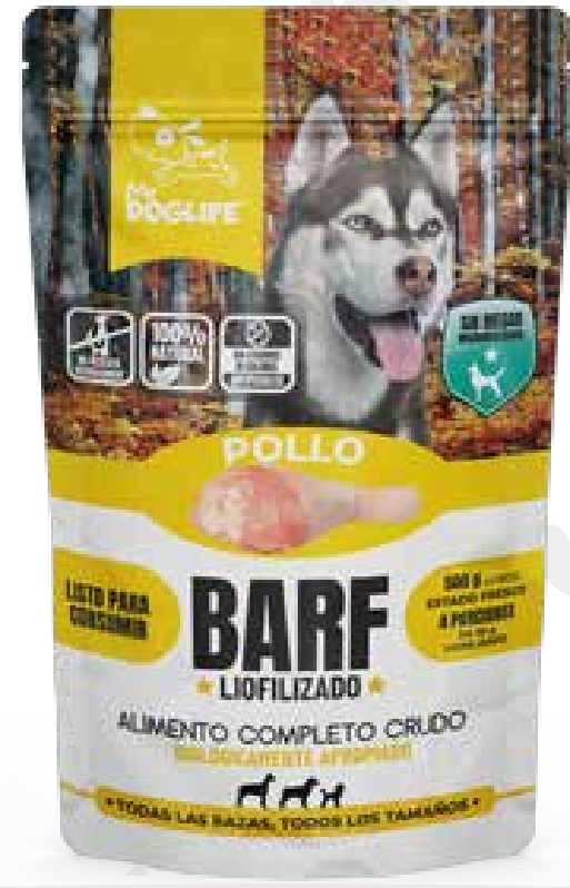
Barf pollo 175 gms liofilizados