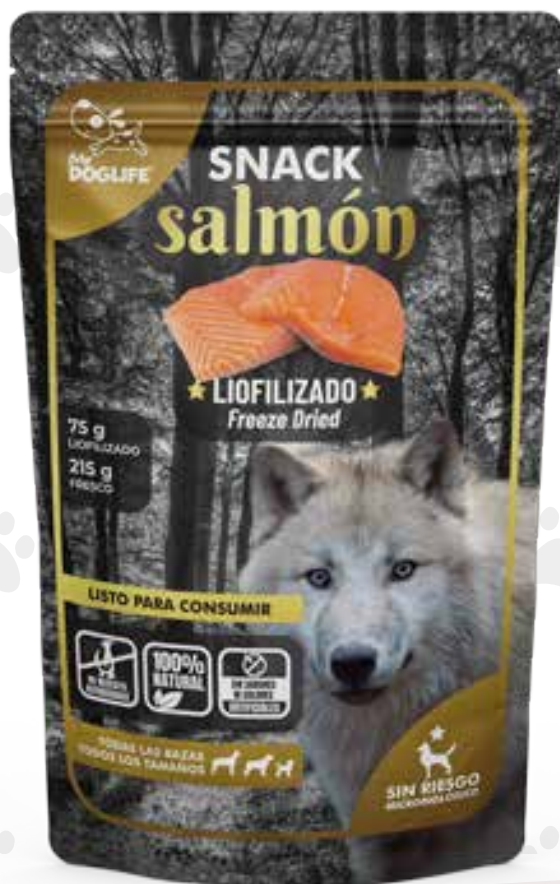
Snack de salmon 75g.