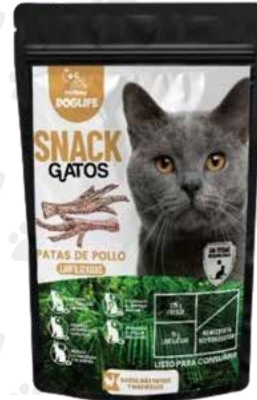
Snack patas de pollo 75 g