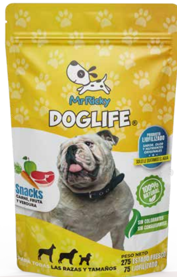
Snack de Carnes, frutas y verduras 75g.