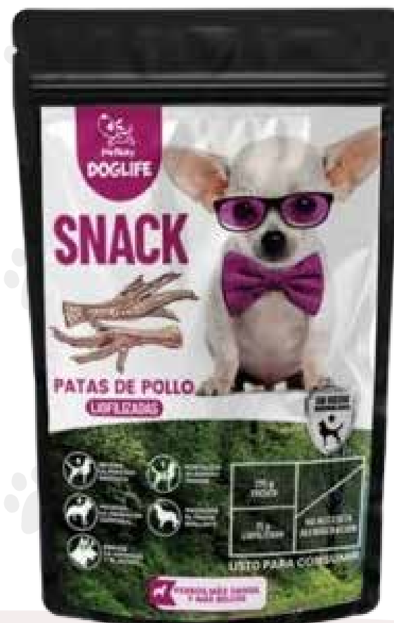
Snack patas de pollo 75g.