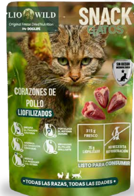
Snack corazones de pollo 75 g