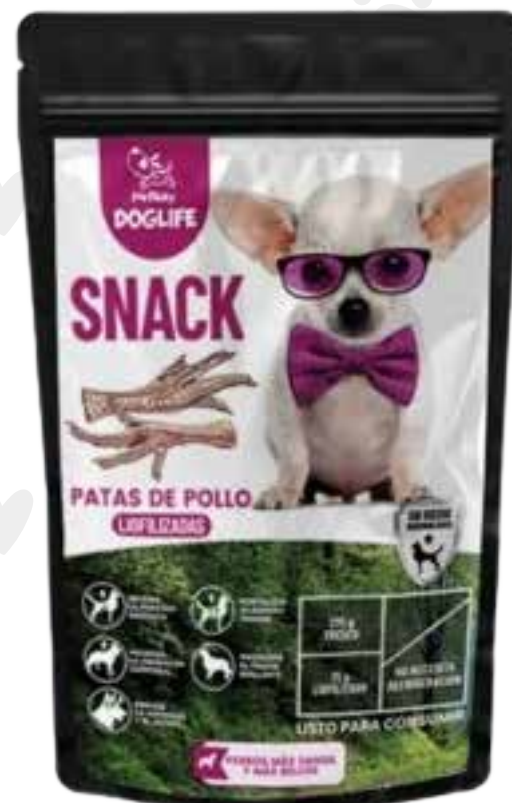
Snack patas de pollo 75g.