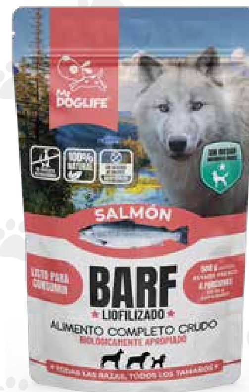
Barf salmón 200 gms liofilizados