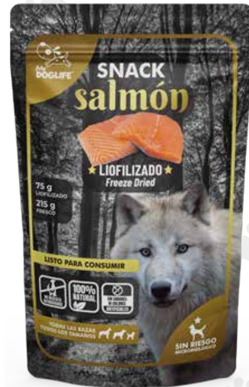
Snack de salmón 75 g