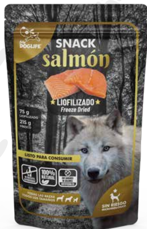
Snack de salmon 75g.