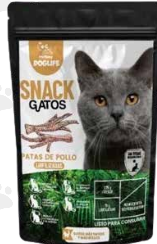
Snack patas de pollo 75 g