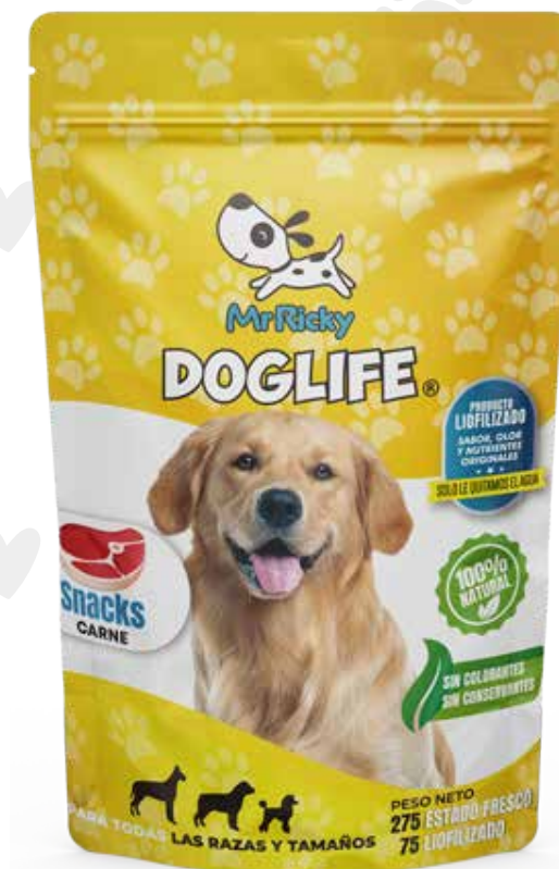
Snack de carne 75g.