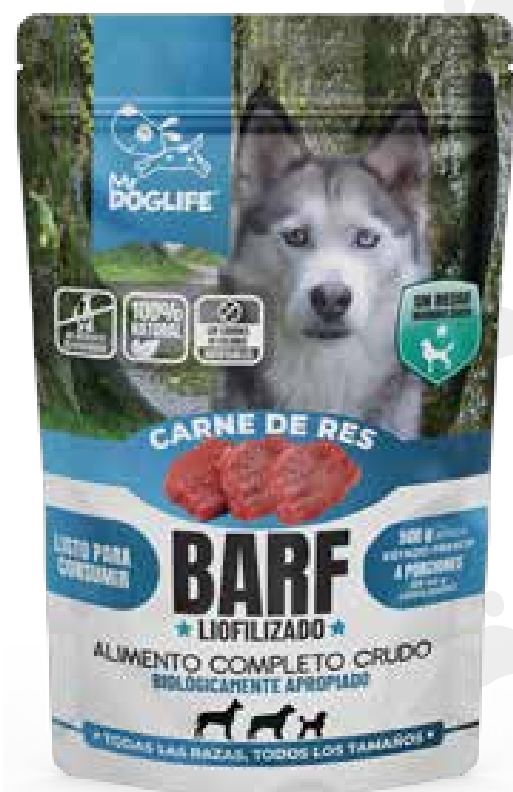
Barf carne de res 200 gms liofilizados