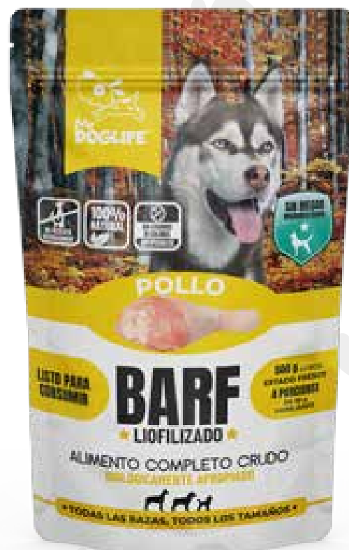
Barf pollo 175 gms liofilizados