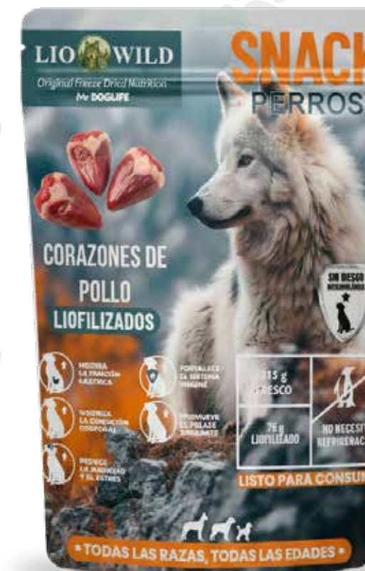
Snack corazones de pollo 75g.